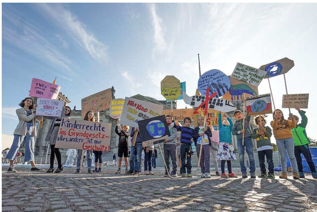
Diese Kinder trafen sich zum Weltkindertag.

Auch Schule und Bildung sind wichtige Themen. Außerdem sollten Kinder in ihrem Alltag mitreden dürfen. Als Beispiel nennt die Expertin den Schulalltag in Corona-Zeiten: „Da hat keiner die Kinder nach ihrer