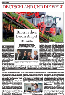
Deutschland und die Welt