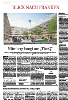
Blick nach Franken/ Hammelburg