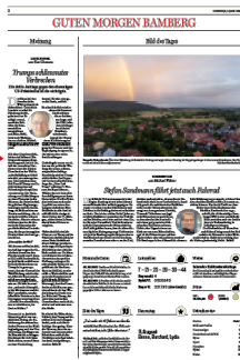
Meinung & Hintergrund