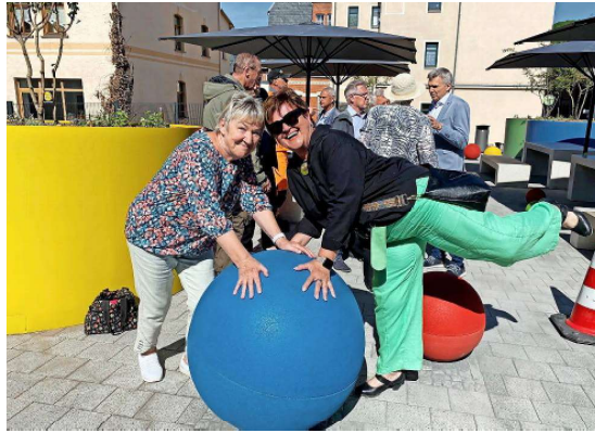
Am früheren „Haus der Dame“ soll es Mitmach- und Kreativangebote geben. Diese Station wurde bereits im Mai eröffnet. Die „Spielmeile“ führt über zwölf Stationen vom Bahnhof bis zum Spielzeugmuseum.

Augmented Reality trifft Teddybar Ein echtes Highlight ist die Integration von Augmented Reality: Mit dem Smartphone erwachen Sonnebergs Spielzeugfiguren wie das Reiterlein oder der Teddybar zum Leben und werden zu Spielzeugbotschaftern. Historische Gebäude erscheinen digital rekonstruiert, und wer möchte, kann ein Selfie mit einem virtuellen Spielzeuggestalt machen. „So wird Geschichte nicht nur erzählt, sondern erlebt – ein Paradebeispiel für Design als Vermittler zwischen Vergangenheit und Zukunft“, sagt die Pressesprecherin der Stadt, Cindy Heinkel. Das Coburger De-