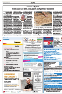
Franken/ Bad Brückenau