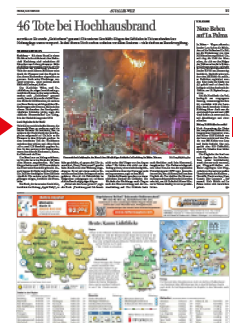
Aus aller Welt