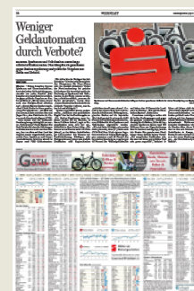
Wirtschaft mit Börse

Unter der Woche hat die Tageszeitung – je nach Zeitungstitel – zwischen 28 und 32 Seiten. Und sie ist jeden Tag ganz unterschiedlich: Am Montag steckt viel Sport drin, den Dax- und Dollarkurs gibt es von Dienstag bis Samstag.