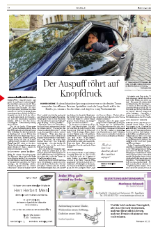
Franken/ Bad Brückenau